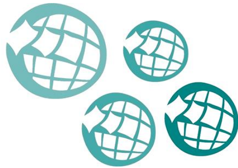
DIAGRAMA DE ACCIÓN